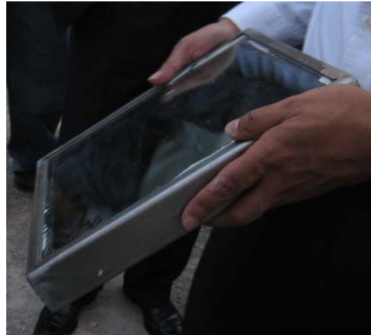
RESULTADO DE LOS IMPACTOS DE LOS PROYECTILES EN LA PROBETA MUESTRA, VISTAS POSTERIORES