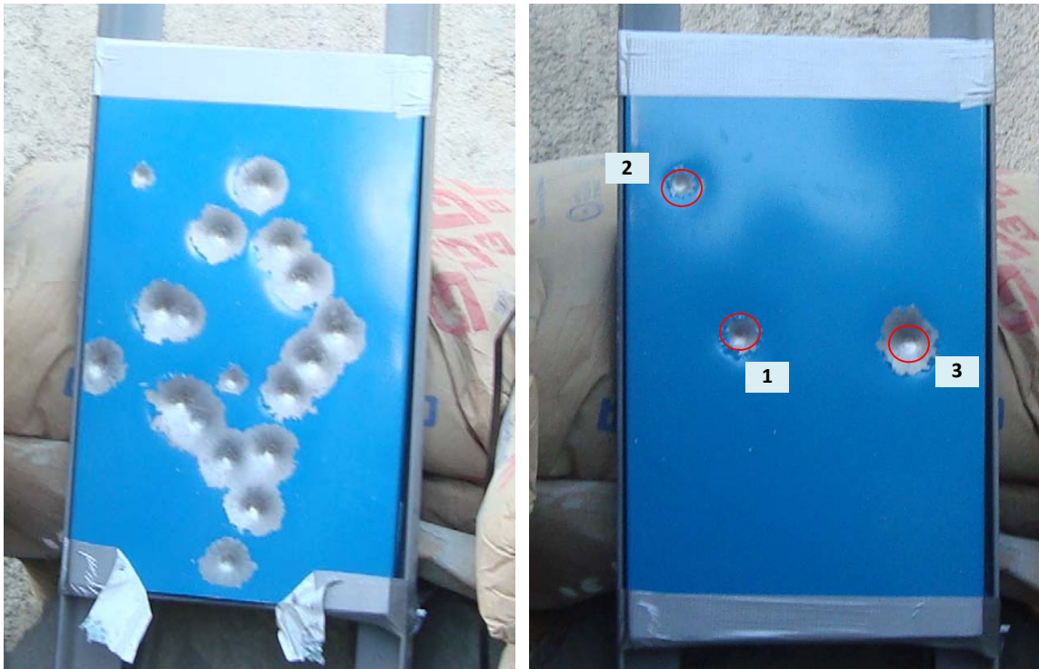
RESULTADO DE LOS IMPACTOS DE LOS PROYECTILES EN LA PROBETA MUESTRA, VISTAS FRONTALES