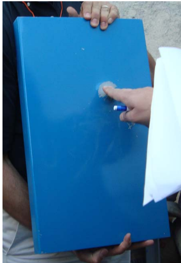
RESULTADO DE LOS IMPACTOS DE LOS PROYECTILES EN LA PROBETA MUESTRA, VISTA FRONTAL (izq.) Y POSTERIOR (der.)